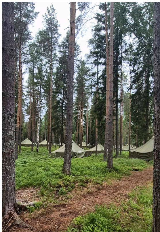
Militärtälten var uppställda i skogen bredvid Kotka flygfält.

frukostbuffé och stiga i land i Finland. Direkt på bussen igen och nu åkte vi mot Kotka i sydöstra delen av Finland. Ungefär fem kilometer innan arenan möttes vi av en bilkö som rörde sig ungefär inte alls. Vår extra marginal till damstarten åts snabbt upp i kön och läget blev allt mer stressigt. Men just som Pelle hade funderat på att gå i förväg och hämta ut lagkuverten då även han "kan hålla högre tempo än detta", släppte kön och vi kunde rulla vidare, nästan hela vägen fram till våra militärtält.