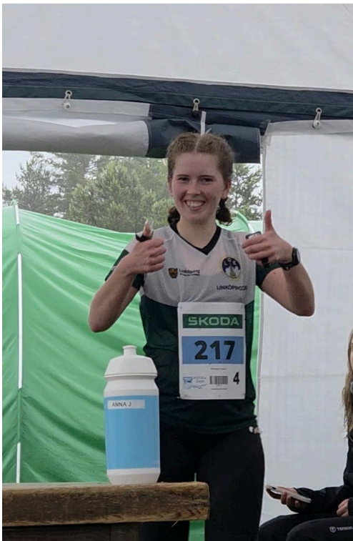
Två tummar upp för de finländska skogarna!

Så, se till att hänga med nästa år! Även med ösregn och lera upp till knäna så lovar jag att det blir en fantastisk upplevelse!