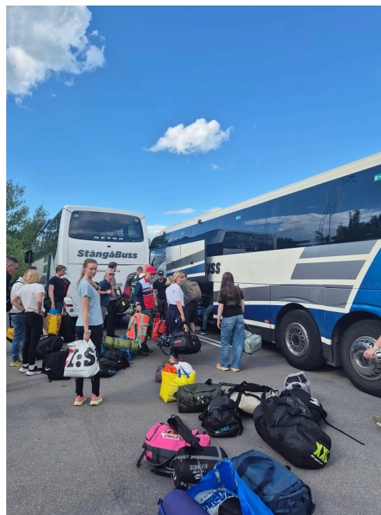
Byte av buss.

Faktum var att bussen fylldes så pass att det inte fanns en enda ledig plats över. Hmm, men vi har ju ytterligare fem personer som ansluter i Stockholm? Det visade sig att vi fått fel buss. Så lagom när vi kommit ut på E4:an svängde vi av E4:an och styrde mot Stångåbuss bussdepå i hopp om att det eventuellt skulle finnas en större buss vi kunde byta till. Det fanns det. Phuh.