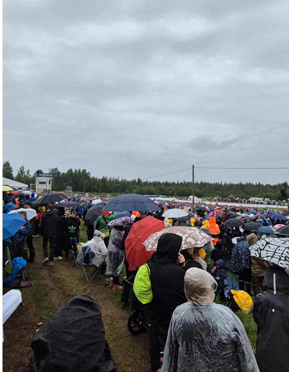
Det var svårt att se så värst mycket av Venlastarten för alla paraplyer.

Terrängen i Kotka var platt och bitvis detaljfattig, bitvis stenigt och mer svårlopt. Det gällde att ha koll på riktningen och läsa på de detaljer som fanns att läsa på. Precis min typ av orientering! Riktigt roligt från start till slut (med undantag för ett hav av sly under kraftledningen till 11:an där jag funderade på vad jag höll på med).